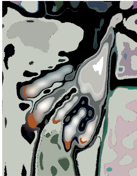
Print -Painting IJ - Jungle of Eden - Hndscp -Level 1/1C - 70 x 90 cm.

Ook de keuze om de portretten in eerste instantie als Print -Paintings te presenteren kan daarbinnen worden begrepen. In hun digitale toestand houden ze het uiteindelijke olieverfschilderij op doek – consequent de volgende stap binnen Jossa's kenmerkende procedure – al in zich. Toch kunnen ze enkel een indicatie zijn, een vooruitblik naar wat komt. Het bevraagt de positie van de kunstenaar binnen de virtuele ruimte, tast de marges van de digitale representatie van het werk af. Is dit een substituuut of een autonome fase? Wat is de waarde van de kille pixel in verhouding tot de handmatige penseelstreek?