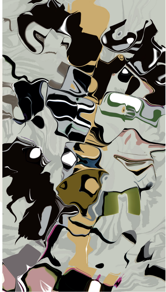
Print -Painting IJ - Jungle of Eden - Cty prfl -Level 6/1G - 50 x 90 cm.