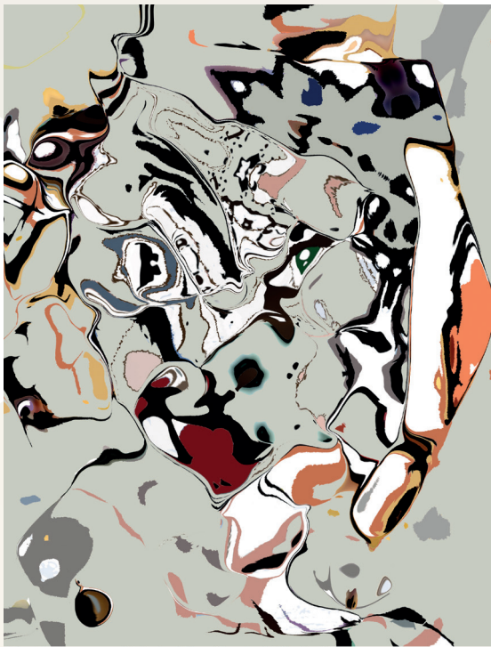
Print -Painting IJ - Jungle of Eden - Stlking -Level 4/2C - 80 x 110 cm.