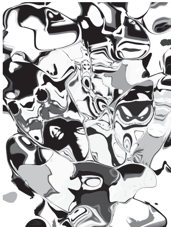
Print -Painting IJ - Jungle of Eden - Stkg -Level B&W 1/1B - 80 x 110 cm.